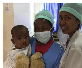
Mission 8 : Chirurgie Maxillo-Faciale Madagascar Vatomandry Mai 2018