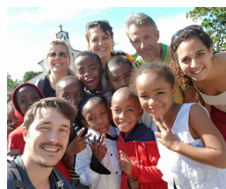
Mission 9 : Chirurgie Orthopédique Madagascar Antsirabé Mai 2018