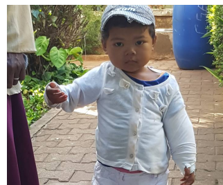
Mission 6 : Chirurgie Orthopédique Bénin Février 2018